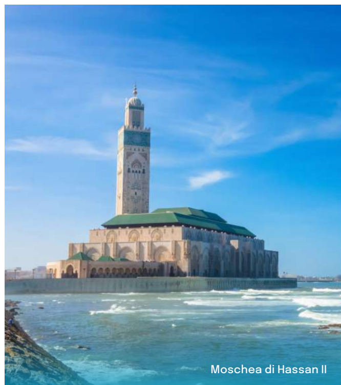
Moschea di Hassan II

Prima colazione. Tempo libero a tua disposizione a seconda dell'orario di partenza del volo e in seguito trasferimento all'aeroporto.