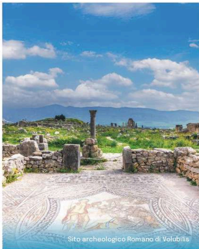
Sito archeologico Romano di Volubilis

Bab El Khemis, Bab Mansour, la piazza El Hedhim.